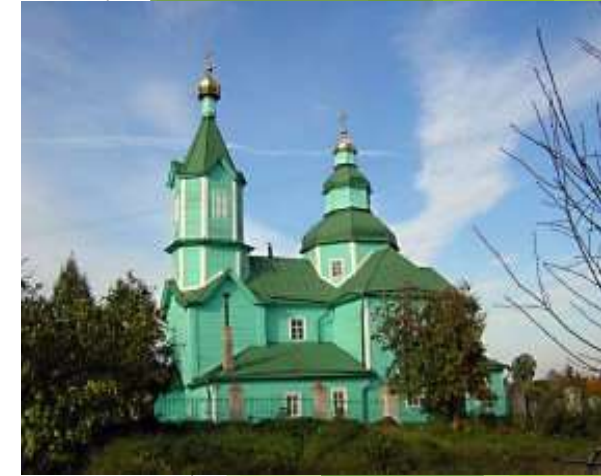
Храм сошествия Святого духа Невельский район, д. Плиссы Деревянный 1747 г. (объект культурного наследия федерального значения)