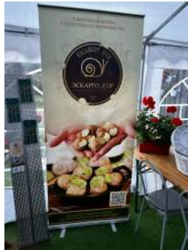
Улиточная ферма «Эскарго Д'ОР» Невельский район, д.Опухлики, д,57