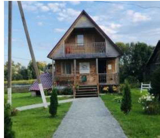
Гостевой домик Невельский район, д. Усть-Долыссы, ул. Береговая, 12