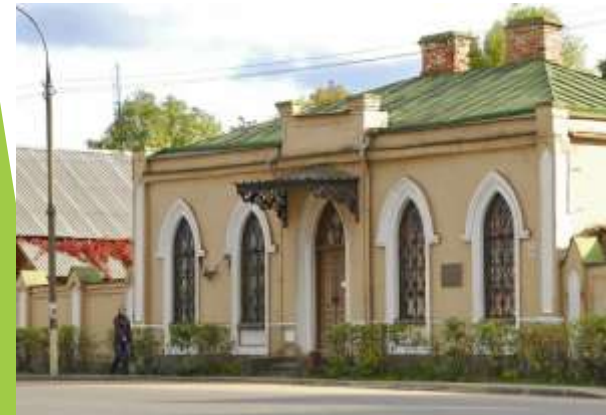
Здание МБУ «Музей истории Невеля» г. Невель, ул. Ленина, д.14 Ансамбль бывшей почтовой станции, 1849 г. (объект культурного наследия регионального значения)