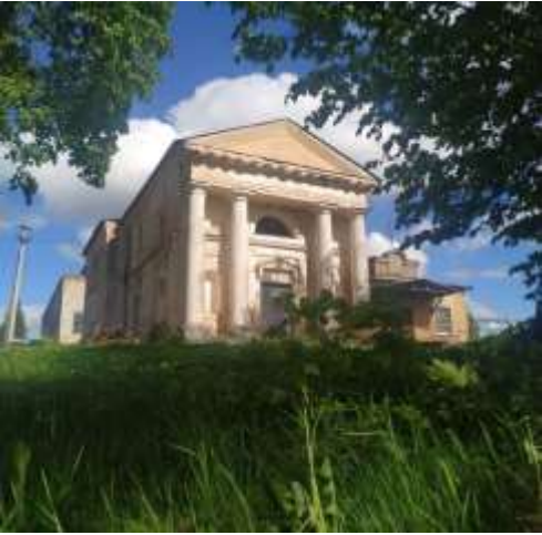
Храм Иоанна Предтечи Невельский район, д. Иваново 18 век, на территории бывшего имения И.И. Михельсона (объект культурного наследия федерального значения)